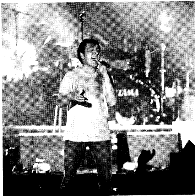
Manolo García —a l'esquerra— presentarà «Para que no se duerman mis sentidos». A la dreta, Lax'n'Busto.

● El camp municipal d'esports d'Empuriabrava s'està consolidant en un referent dels estius pel que fa als concerts. Castelló d'Empúries ha apostat des de fa anys per aprofitar la festa major de Sant Llorenç per dur a l'Alt Empordà artistes de renom i amb capacitat d'atraure el públic. Hi han passat Julio Iglesias, Joaquín Sabina o els televisius Manu Tenorio i David Bisbal. Aquest any, l'estrella és Manolo García, que ha triat Empuriabrava per fer-hi l'única actuació a les comarques gironines de presentació del seu nou disc, Para que no se duerman mis sentidos . És el concert més car de la programació de l'Esbrava't, ja que costarà setze euros, si l'entrada es compra anticipadament. Manolo García ac-