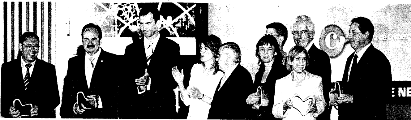
Els prínceps d'Astúries i els guardonats per la Cambra de Comerç de Girona en els IV Premis Girona Convention Bureau, que es van celebrar a Peralada. / MIQUEL RUIZ.