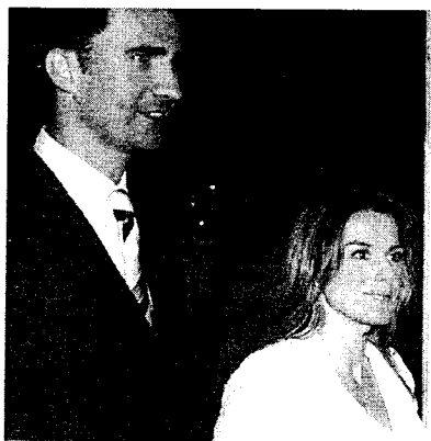
Els prínceps, mentre es dirigien al concert que va oferir Jaume Aragall al Castell de Peralada.