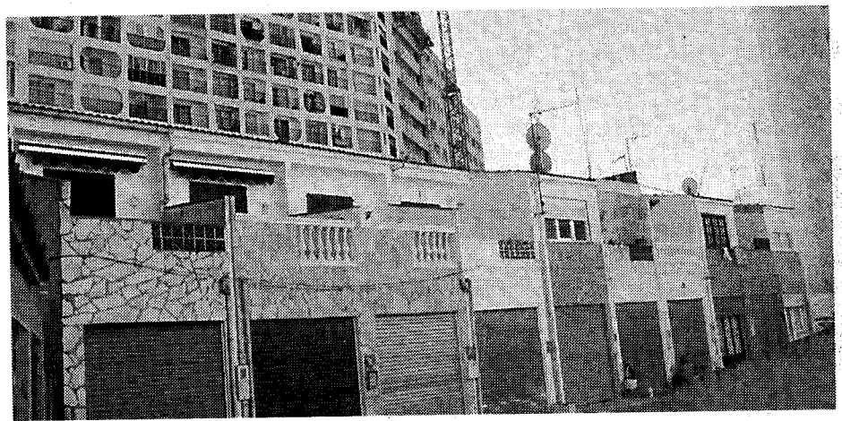
Als anys 70 es van fer fileres de garatges que s'han convertit en habitatges i ara es volen enderrocar.

tuir una zona de petits garatges en filera per places d'aparcament públiques en superfície.