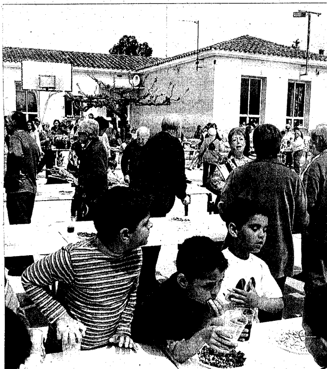
L'escola de Garriguella va celebrar l'aniversari per Sant Jordi