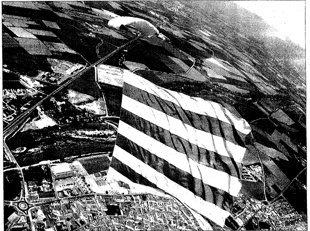
La senyera, de 300 m 2 , va ser llançada en paracaigudes des d'una alçada de 2.000 m

L'aterratge va tenir lloc al costat de l'institut d'educació secundària de la vila, situat al carrer on es troba el conegut rentador. Sardanes, teatre, roses i molts llibres van completar els actes amb els quals el municipi castelloní va celebrar l'emblemàtica jornada. A Roses, el bon temps va acompanyar al llarg de tot el dia els visitants que s'apropaven a les parades, instal·lades al llarg del passeig marítim del municipi.