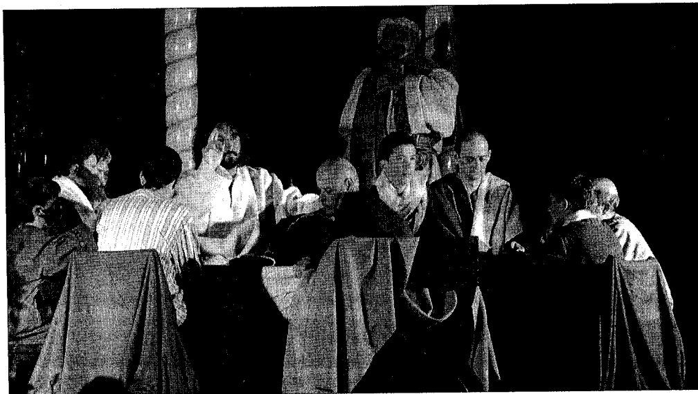
A dalt, una de les escenes representades a Castelló d'Empúries. A baix, el Mercat Jueu de Sant Climent

Per oferir l'espectacle al major nombre de públic possible, es va habilitar una zona de la catedral amb accés per persones amb discapacitats físiques. També hi haurà una pantalla on es podrà llegir en quatre idiomes, els textos que els actors escenificaran, per tal que la gent amb problemes d'audició no tingui dificultats. Les tres sessions tenien una durada aproximada d'una hora, en la qual els actors representaven els vuit quadres