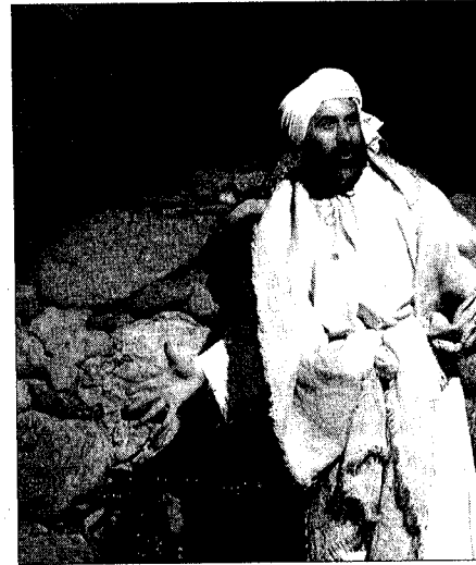
D'esquerra a dreta, dues de les lectures que es van escoltar a la Passió de castelló d'Empúries, i una imatge de la representació de Sant Climent