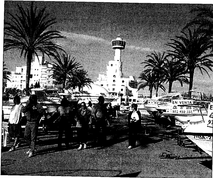
Un grup de persones passeja entre els vaixells de la Fira.

A banda de les embarcacions d'ocasió, també hi haurà estands de venda de productes relacionats amb el món nàutic: roba, productes de neteja, complements, etc. Les embarcacions, provinents de tota la costa catalana, es trobaran