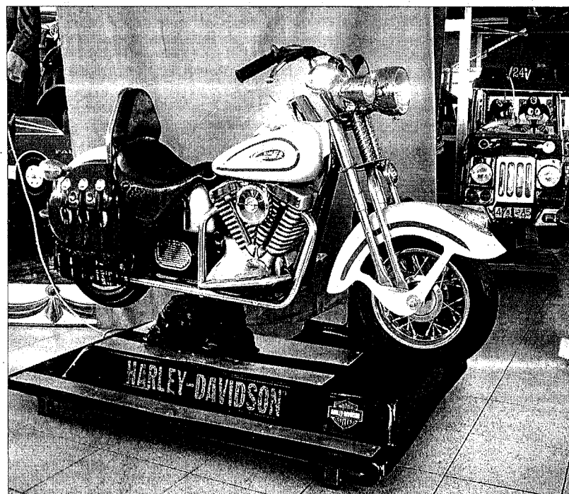
Una de les moltes màquines en les quals s'introdueix una moneda a canvi d'un viatge