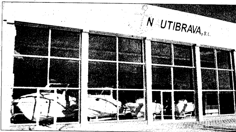
Una imatge de la façana de Nautibrava i dels diferents models que es poden veure a la náutica