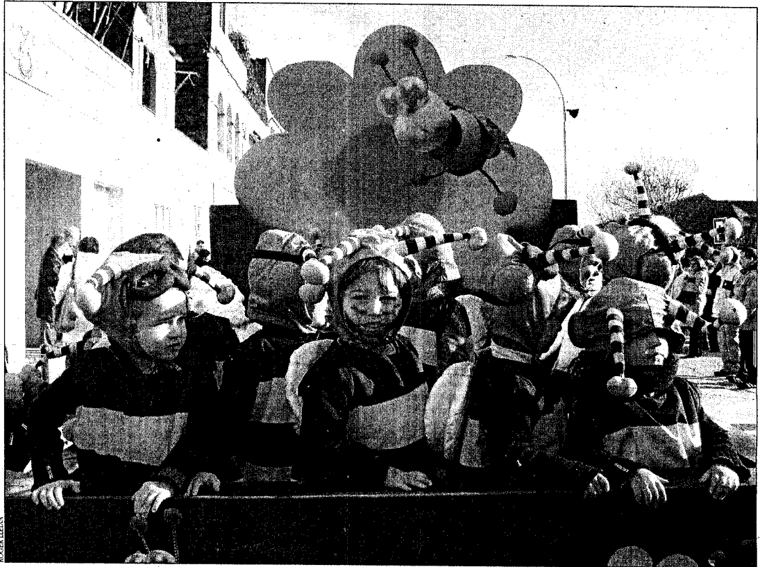
La cercavila infantil es farà el dissabte a la tarda; tots els nens que hi participin podran berenar i gaudir d'un espectacle amb el grup Plàstics

Les cercaviles que es faran entre divendres i diumenge no sols desfilaran pels carrers del nucli antic sinó també per Empuriabrava. Abans del nou striptease del divendres, l'avinguda Fages de Climent de la urbanització s'omplirà de gom a gom amb carrosses i comparses. L'any passat eren més de trenta carrosses i cinquanta comparses les que hi van participar. Martín ha confirmat que s'intentarà treure tots els vehicles de l'avinguda, tot i que és una tasca difícil ja que requereix molt de personal. La cercavila del dissabte a la tarda tindrà un altre caire ja que estarà