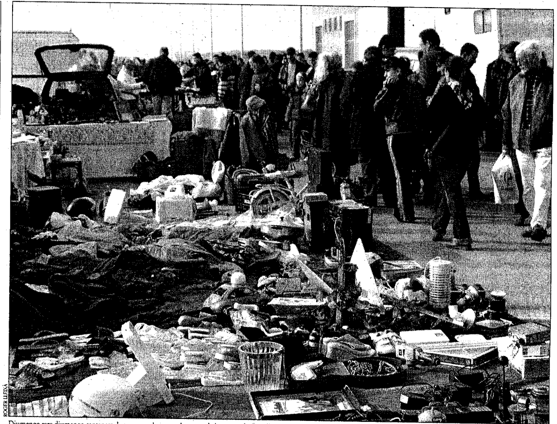
Diumenge rere diumenge centenars de persones s'acosten al mercat de les puces de Castelló Nou

El gran poder de convocatòria del mercat de les puces es deu, en gran part, per l'oportunitat que dona al comprador d'aconseguir tot tipus de productes a preus molt inferiors als que es poden trobar en un establiment convencional. A aquest fet cal sumar-hi la norma no escrita del regateig, és a dir, la possibilitat d'aconseguir un producte a un preu pactat amb el venedor. De Jaegher indica que el perfil del públic varia molt. Així, mentre que a l'estiu, la gent que tafaneja entre les parades són majoritàriament turistes "que vénen a passar l'estona", a l'hivern hi ha "gent del país" disposada a comprar. Pel que fa al perfil del venedor, només un vint per cent són professionals, mentre que la resta són gent que porta coses de casa per vendre. "Hi ha des del pensionista que vol fer-se un sobresou fins al nen que es desfa de joguines velles o que ja no fa servir", afirma.