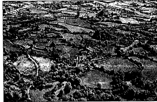
BOSC DE TOSCA. Destaca el patrimoni arquitectònic de l'espai.