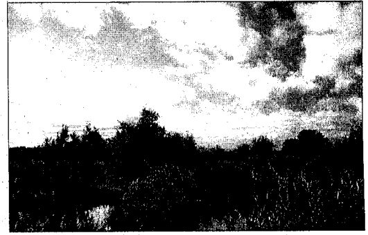
TER VELL. Aquest territori es caracteritza per les aigües i el canyís.

Can Puig de Fitor, amb 170,62 hectàrees, està inclòs en l'Espai Natural de les Gavarres. Aquest massís té un paisatge forestal d'alzinars i suredes, i a més una fauna rica. Des de l'entitat destaquen de les Gavarres el seu patrimoni cultural, ja que s'hi poden trobar elements de valor arquitectònic, històric i cultural com elements funeraris del Neolític, construccions defensives i nuclis medievals, construccions religioses preromàniques i romàniques o masies i cases pairals. També s'hi troben construccions derivades de l'activitat tradicional i l'explotació de recursos, com ara forns de calç i de vidre, molins, rescloses, carboneres, fonts o pous de glaç.