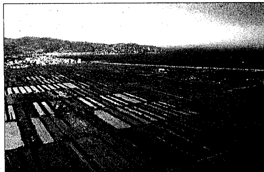
LA RUBINA. L'espai es caracteritza per les peces del seu terreny.

part de la colada del volcà Crosat i ocupa unes 25 hectàrees. Al llibre Paisatges vius expliquen que originàriament els territoris eren del monestir de Sant Benet de Bages, però a finals del segle XIX es van anar obrint camps de conreu envoltats de murs de pedra seca. Ara la Fundació és propietària d'unes finques que formen part del Bosc de Tosca i de les quals n'ha cedit l'ús a l'Ajuntament de les Preses. L'objectiu de l'entitat és preservar i restaurar el patrimoni natural i cultural de l'espai gràcies a un projecte Life que impulsa el consistori.