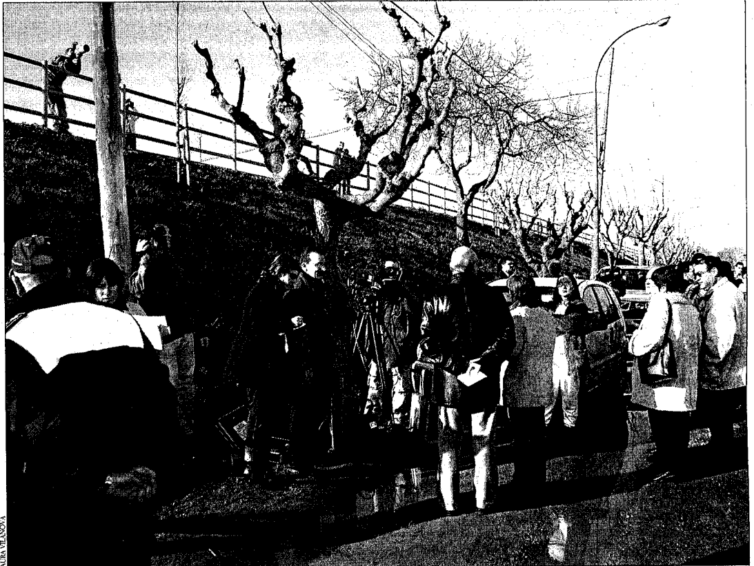
Dotzenes de curiosos i mitjans de comunicació es van concentrar dilluns a tocar l'edifici sinistrat

L'Ajuntament de Castelló d'Empúries ha celebrat aquest dimarts un ple extraordinari en què totes les forces polítiques han acordat declarar tres dies de dol per una tragèdia que ha sacsejat la tranquil·litat de la localitat.