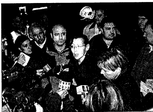
La consellera d'Interior va oferir una roda de premsa en el lloc dels fets