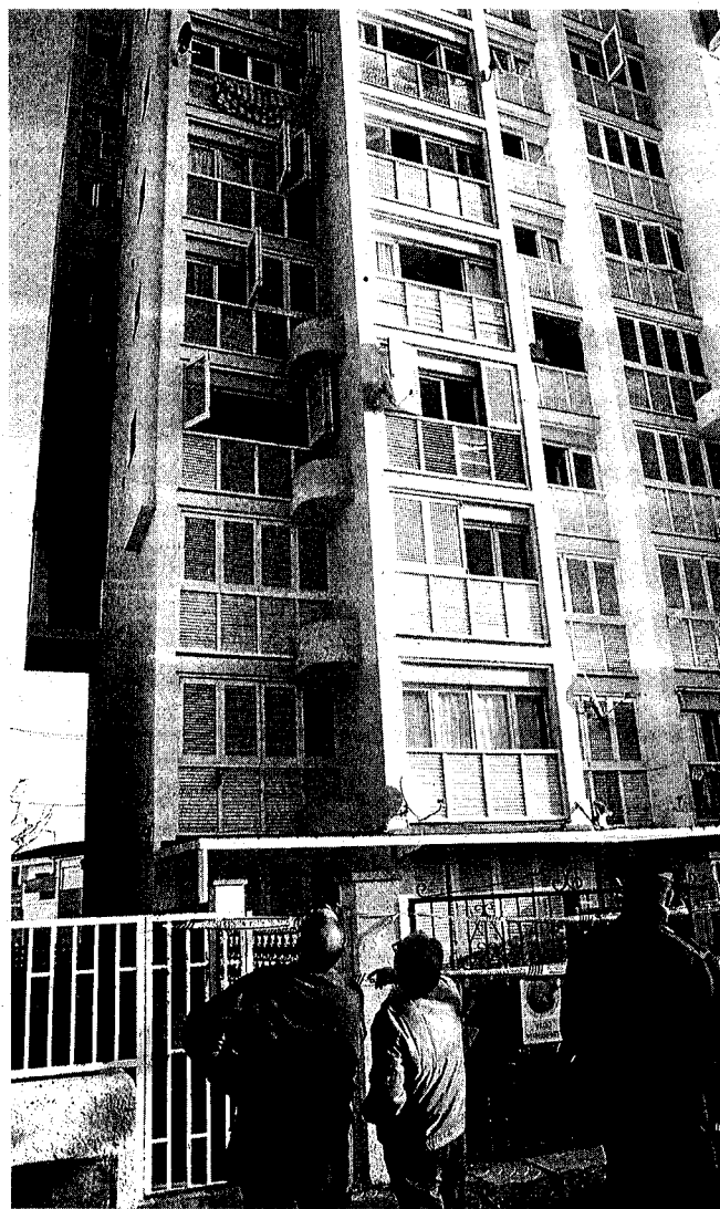
Una gent, ahir al matí, davant de l'edifici sinistral. / ROBIN TOWNSEND / EFE.

Pia Bosch va sortir al pas de les crítiques d'alguns testimonis sobre la rapidesa d'actuació dels cossos d'emergència. En aquest sentit, assegura que l'actuació va ser «ràpida i