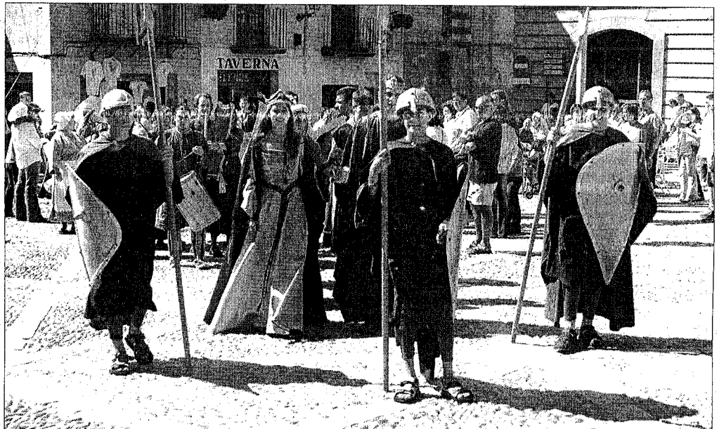
L'ambientació medieval és un dels aspectes que més es cuiden al Festival Terra de Trobadors

Aquest tractament de la diversitat cultural que encaixa perfectament amb un dels eixos del Fòrum de les Cultures de Barcelona, ha propiciat el fet que el Festival s'hagi adscrit com a activitat asso-