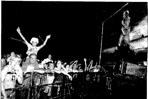
PANTALLES GEGANTS. Per poder seguir millor les evolucions de l'ídol.