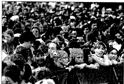
FEMENÍ I MOLT JOVE. Les característiques de la major part del públic.