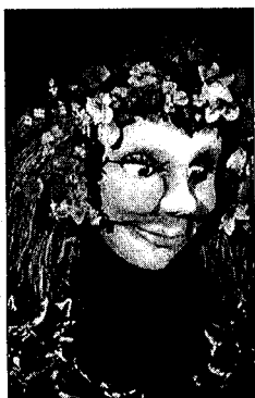
Una de les titelles de l'espectacle