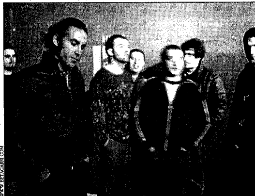
Betagarri va néixer fa deu anys a Vitoria-Gasteiz i té per costum actuar sovint a Catalunya

El cartell musical de la Festa Major de Sant Llorenç de Castelló d'Empúries inclou, a part dels noms de David Bisbal i Extremoduro, un concert, aquest divendres, dia 6, dels coneguts Betagarri i Suite Mosquito. Les actuacions del grup basc i del grup gironí, les telonejarà la formació Dekrèpits. El festival musical tindrà lloc al camp municipal d'esports, a partir de les 11 de la nit. Les entrades són gratuïtes.