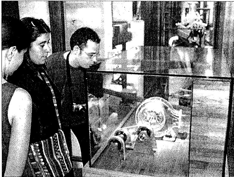
PROCÉS PRODUCTIU. L'interior de la farinera on es pot conèixer el procés d'elaboració de la farina.

■ Castelló d'Empúries també pretén potenciar la indústria sostenible