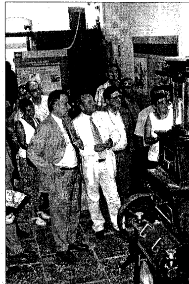
INAUGURACIÓ. El conseller i les autoritats fent la visita.