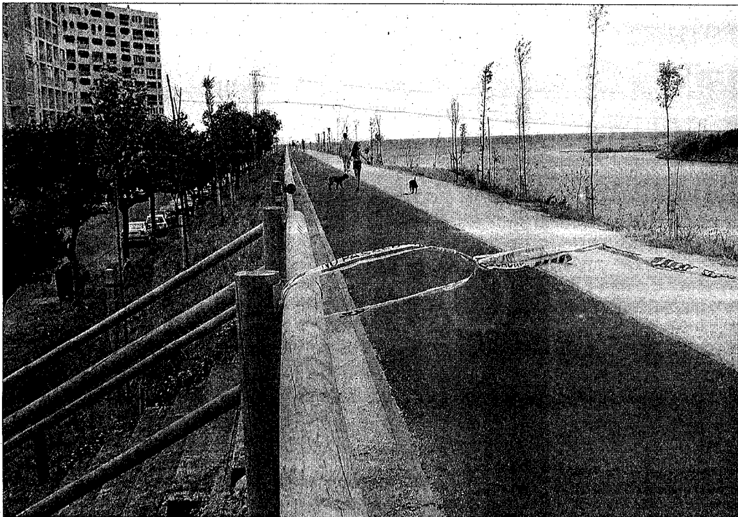
FUGIDA. Un tros de cinta marcava ahir el punt des d'on la víctima va saltar al riu.