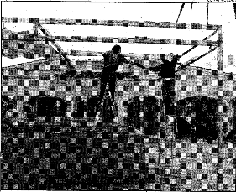
A punt. L'establiment obrirà les seves portes el proper 21 de maig.