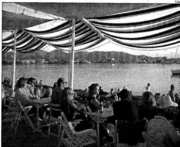
L'origen. L'establiment d'Eivissa permet veure les postes de sol.