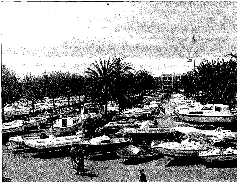
La Fira del Vaixell d'Ocasíó se celebra cada any coincidint amb les vacances de Setmana Santa.

Tots els visitants de la Fira d'enguany, a més de poder veure les embarcacions, podran gaudir en el mateix recinte firal de diferents estands variats com de complements náutics, llaminadures, roba náutica, assessoria, immobiliària... com a novetat hi haurà una nova àrea destinada a la venda de material de Kite-surf de segona mà. Aquest any a més l'associació Tot Comerç sortejarà una embarcació típic Zodiac. Per poder participar al sorteig s'hauran d'omplir unes butlletes de participació que seran distribuïdes des dels establiments associats del municipi. El sorteig es realitzarà a la mateixa fira el dimenge 11 d'abril al migdia.