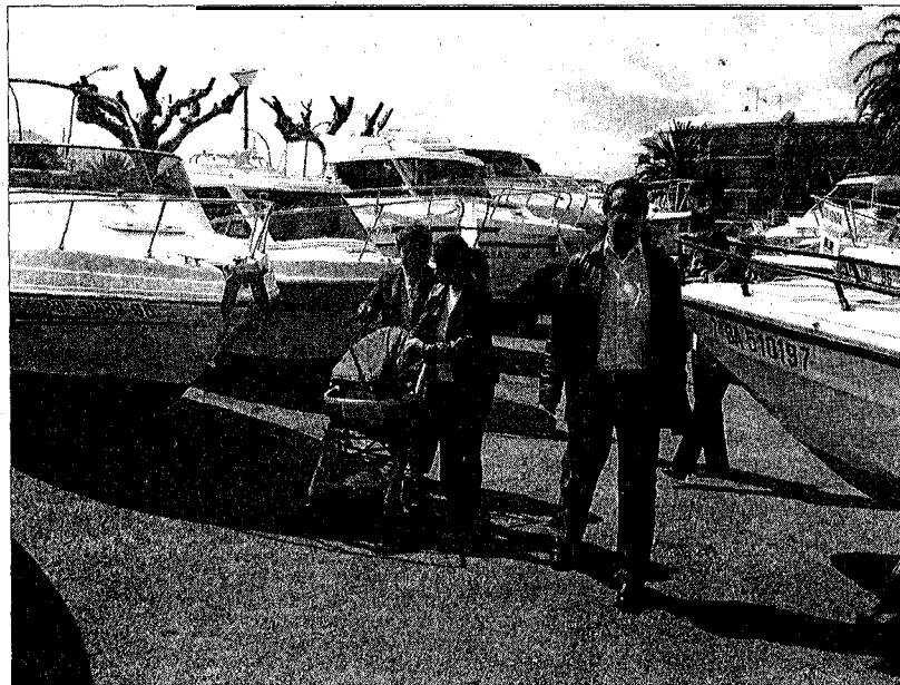
El Port de la Marina acollirà una nova edició de la Fira, que atrau molts compradors i curiosos

Un altre factor que ha fet guanyar prestigi a la fira "és el fet que les embarcacions que es posen a la venda vénen recolza-