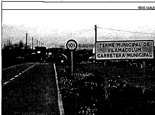
Obres. La reforma es fa durant dos dies al tram entre Sant Pere Castelló.

traven indignats davant la protesta, uns altres comprenien l'acció del consistori vilamacolumenc.