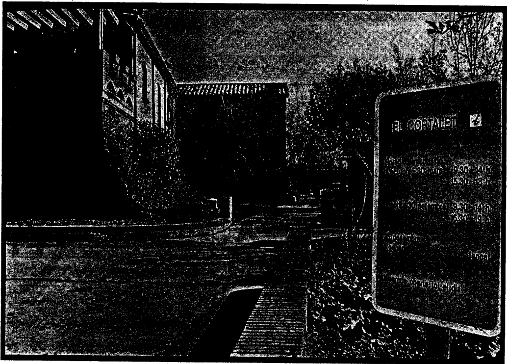
Una imatge d'El Cortalet al Parc Natural dels aiguamolls de l'Empordà

departament informa que s'ha previst acabar la redacció del Pla Especial de Protecció del parc, dur a terme diferents estudis de seguiment de la flora i la fauna que habita al parc i de la qualitat i el cabal de les aigües, i continuar amb el procés d'adquisició de 40 hectàrees de l'Estany de Palau de Baix, situat dins de la Reserva Natural Integral dels Estanys.