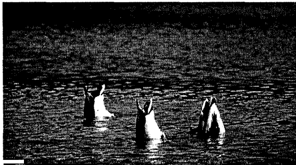
Un grup d'ànecs colverd, a la bassa del Dofi de Castell d'Aro.