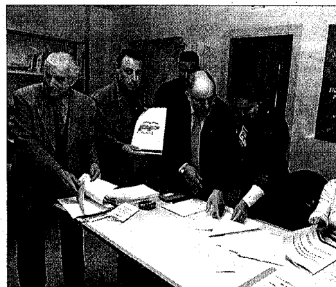
Diversitat de sentiments a les seus de Figueres

La nit electoral es va viure amb especial intensitat a les diverses seus dels partits polítics establertes a Figueres. Militants i simpatitzants van acostar-se al llarg de la nit de diumenge als respectius locals per tal de conèixer de primera mà i comentar els resultats. A dalt, la seu del PSC de Figueres, i a baix, la del PP.