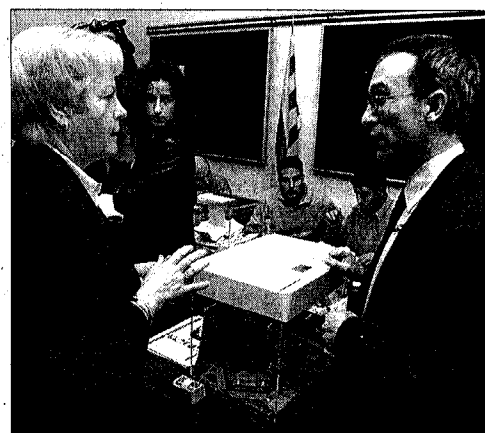
Els veïns de Llers proven el vot electrònic

La nit electoral es va viure amb especial intensitat a les diverses seus dels partits polítics establertes a Figueres. Militants i simpatitzants van acostar-se al llarg de la nit de diumenge als respectius locals per tal de conèixer de primera mà i comentar els resultats. A dalt, la seu del PSC de Figueres, i a baix, la del PP.