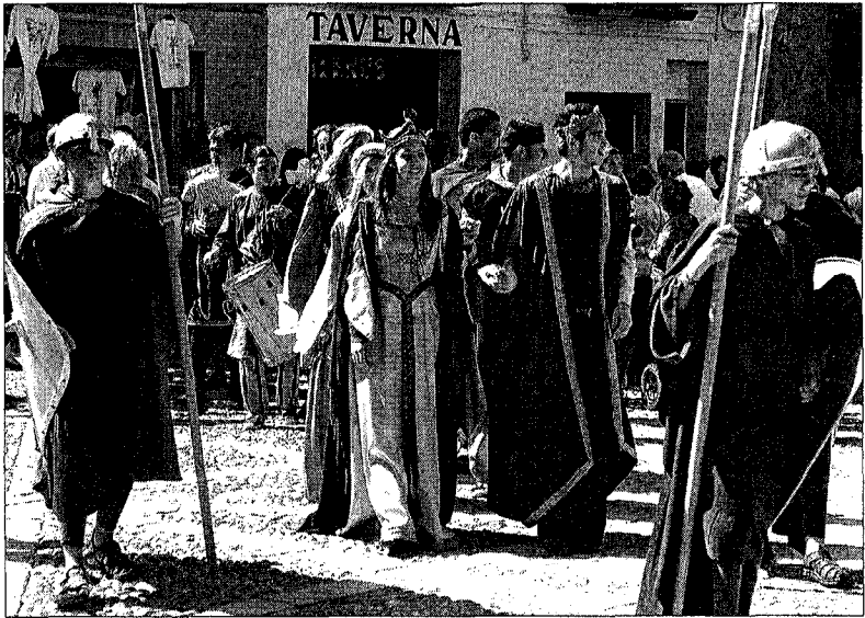
Castelló d'Empúries va revivir el seu passat medieval amb una gran ambientació

Ja fa tretze anys que la vila de Castelló d'Empúries va acollir el primer festival Terra de Trobadors. I, després de tantes edicions, la d'enguany ha volgut oferir novetats centrant el festival en una temàtica: el mar. Sota el subtítol d' Els camins de la mar , la programació que va atreure a 60.000 persones a la vila comtal va utilitzar el tema del mar com a fil conductor de moltes de les activitats. On més es va deixar notar va ser en les conferències que van tenir lloc a la Cúria-presó, amb temes tant interessants com Mites i creences de la gent de la mar o Corsaris i pirates catalans a la Mediterrània .