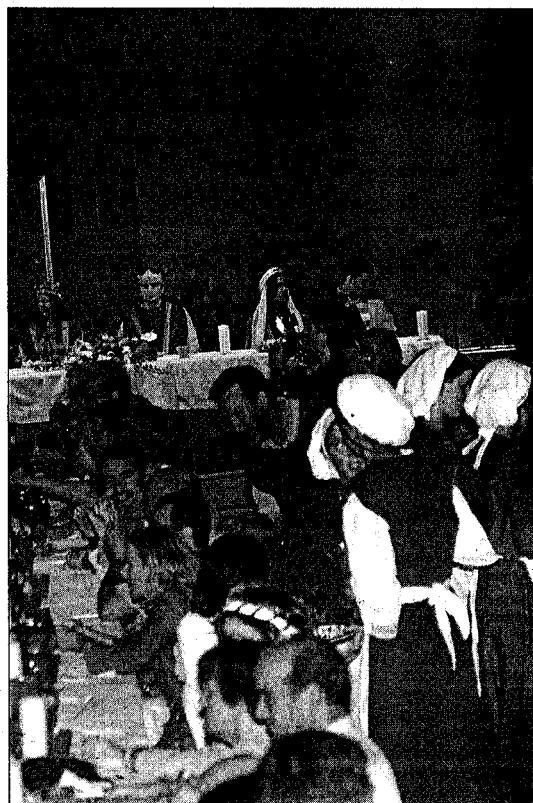
□ Al vaixell pirata, per un euro, "us ho fotrem tot"