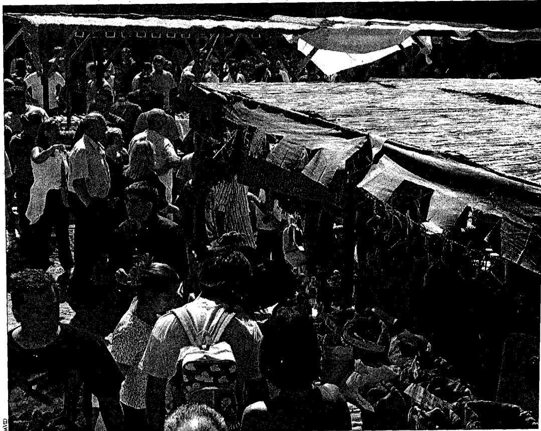
Una imatge del mercat medieval que es va viure a Castelló d'Empúries, el passat diumenge al migdia

No només el mercat va omplir de gent el centre històric castellaní. Els espectacles dels grups que ambientaven "els carrers com si fossin a l'edat mitjana i el sopar medieval del divendres, al pati del Palau dels Comtes, van atraure centenars de persones. Les visites guiades, tant diürnes com nocturnes, van ser una altra activitat sorprenent, fins i tot per als promotors d'aquestes visites. Més de dues-centes persona diàries van poder descobrir els racons més curiosos del conjunt monumental de Castelló. Les visites anaven acompanyades d'espectacularitzacions teatrals. Els concerts de música -la companyia Elèctrica Dharma i Josep Tero- també van obtenir un poder de convocatòria.