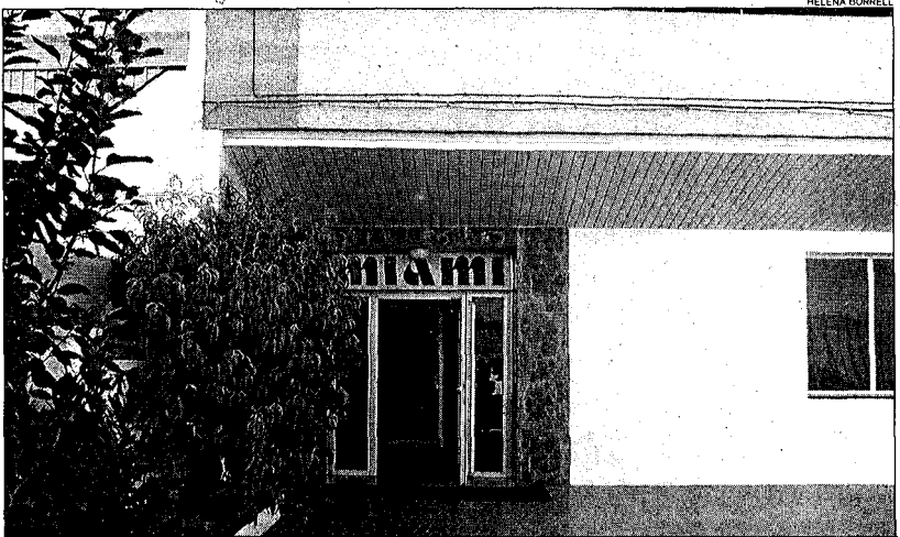
El domicili del difunt. La víctima tenia llogat un pis en aquest edifici del sector Delta Muga d'Empuriabrava.

Les respostes que va improvisar el ciutadà magribí van despertar els recels dels investigadors. Abans de seguir amb el qüestionari, el van advertir que estava detingut. La sessió continuaria en presència del seu advocat.