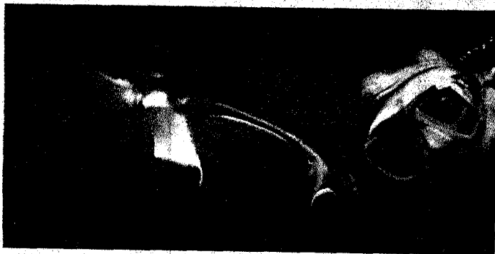
Un estrany exemplar submari