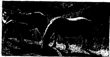
Retrat d'una família equina

Sembla una postal del Sàhara, però correspon al Parc Nacional de Timanfaya, a Lanzarote.