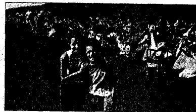
Fals racó del Sàhara

Si sabessin que seran fotografiats, els gira-sols s'exhibeixen davant la càmera en tota la seva esplendor. Els voltants de Castelló d'Empúries, a la Costa Brava, tenen molts pratets verds i grossos entapissats per aquesta flor.