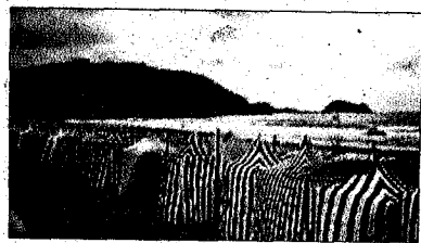
Els encaputxats de Zarautz

Surfers Paradise, a més de ser una de les meques del surf, també és un important centre de turisme familiar. Els comerços, bars i parcs temàtics abunden a la regió.