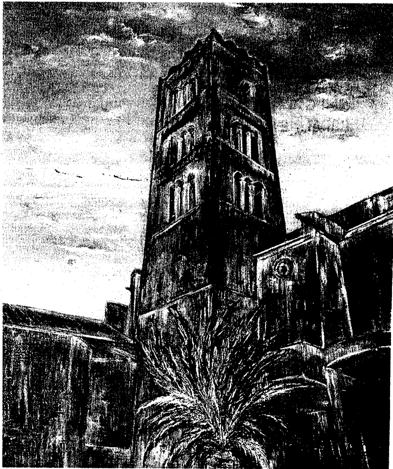
Sta. Maria de Castelló d'Empuries