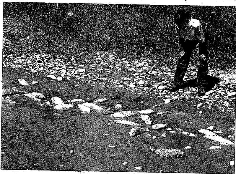
Un agent forestal observa els peixos morts a la llera del riu

Joan Serrallonga, guarda forestal de la Societat de Pescadors de l'Alt Empordà, va portar una cuba amb oxigen per traslladar els peixos a una conca amb aigua, però uns 500 exemplars ja eren morts, i "els que quedaven era pràcticament impossible agafar-los,