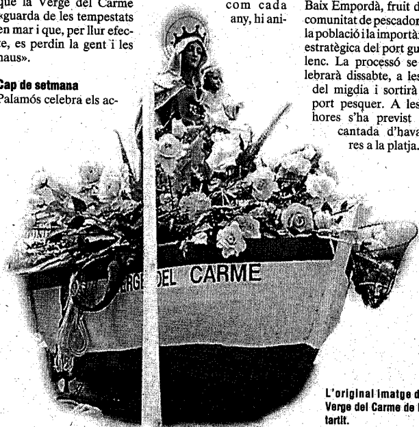
L'original imatge de la Verge del Carme de l'Estartit.

► Drac i Pollastre, al Carme d'Olot. El Drac va treure foc per tots els carrers, i el Pollastre —en la fotografia— del barri de Sant Carme van tor a ballar anit en motiu de la festivitat de la verge d'aquesta advocació. El dia anterior van ballar cercavila amb el Conill i també van ballar. El dia de la Salve i sardanes van cloure la festa. A més, el torn del Cc que ballarà a la nit a la plaça de Sant Joan i el seu r La carcassa interior de la figura del drac s'ha hagut de reforçar perquè s'havia esquerdat.