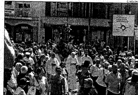
Processó a l'Escala. De la Clota a la platja de les Barques.

A Cadaqués, la barca Gala va tornar a crear expectació, ja que va ser qui va transportar la Verge del Carme. L'acte va ser organitzat per l'Ajuntament, ja que el col·lectiu