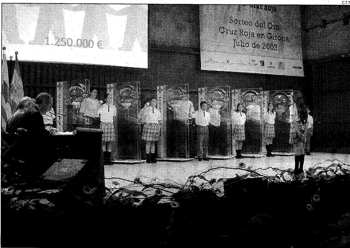
El Sorteig de l'Or. Creu Roja ha repartit milions d'euros o el seu valor en or des de la ciutat de Girona.

L'Auditori de la Mercè acollia unes 200 persones que van seguir atentament el desenvolupament del Sorteig de l'Or de Creu Roja. Aquesta era la primera vegada en els vint anys d'existència del Sorteig que es desenvolupava a Girona. Els diners recaptats amb la compra de les butlletes Creu Roja els destina a finançar projectes so-