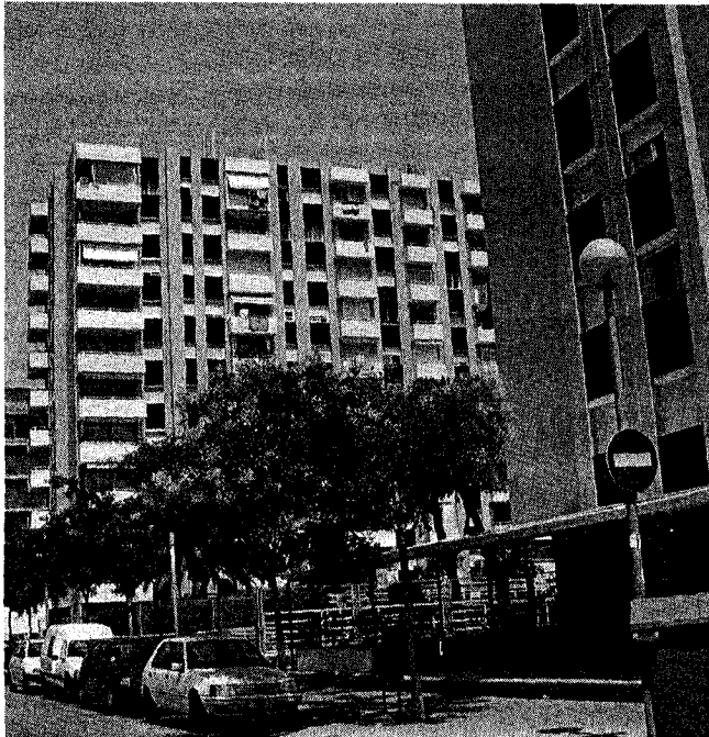
Els apartaments turístics de la Costa Brava han punxat en aquest inici de temporada. A la fotografia, un bloc d'apartaments a Blanes. / LAURA JUANOLA.

El conseller va voler remarcar que, tot i aquesta aparent recessió en la temporada estiuenca, de gener a maig a Catalunya s'ha experimentat un creixement del turisme del 4,4% respecte a l'any passat. Això es concreta en 7,9 milions de turistes que haurien passat per Catalunya fins ara. Pel que fa a la nacionalitat, el 30 per cent de les visites correspondrien a turistes francesos, que incrementen la seva presència 4 punts respecte a l'any passat. Els turistes alemanys mantenen la