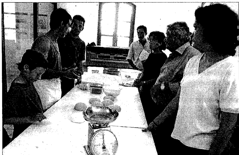
El taller de fer pa va tenir molta participació