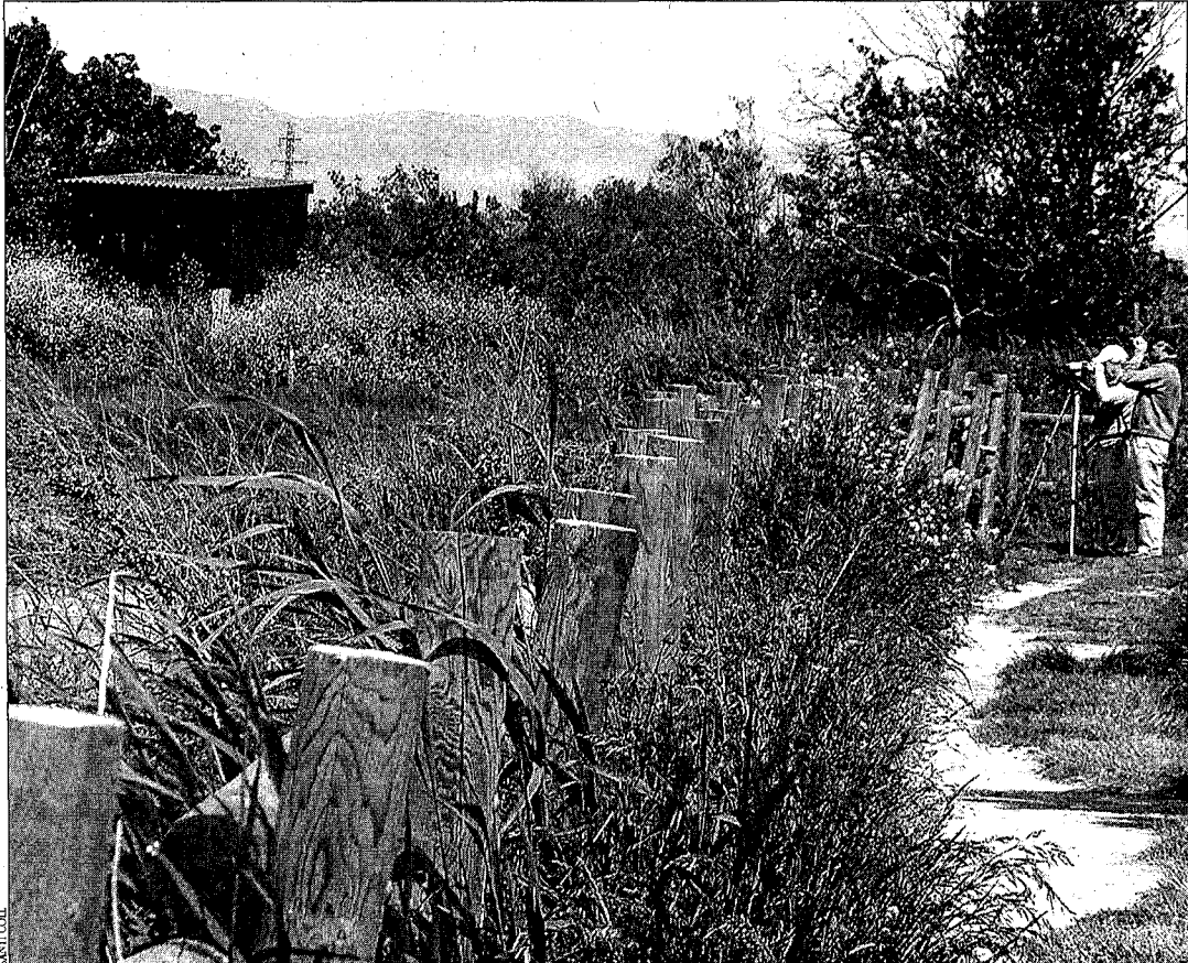
Aquesta primavera ha estat força òptima al Parc Natural dels Aiguamolls, on cada dia hi arriben visitants de tota mena i ornitòlegs apassionats en contemplar els ocells