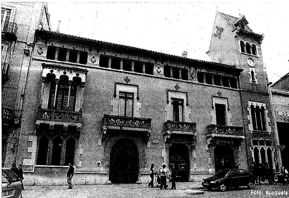
L'edifici Cusi de la Rambla LO Llotja de Castelló d'Empúries van ser restaurades per l'empresa de Jesús Costa SL