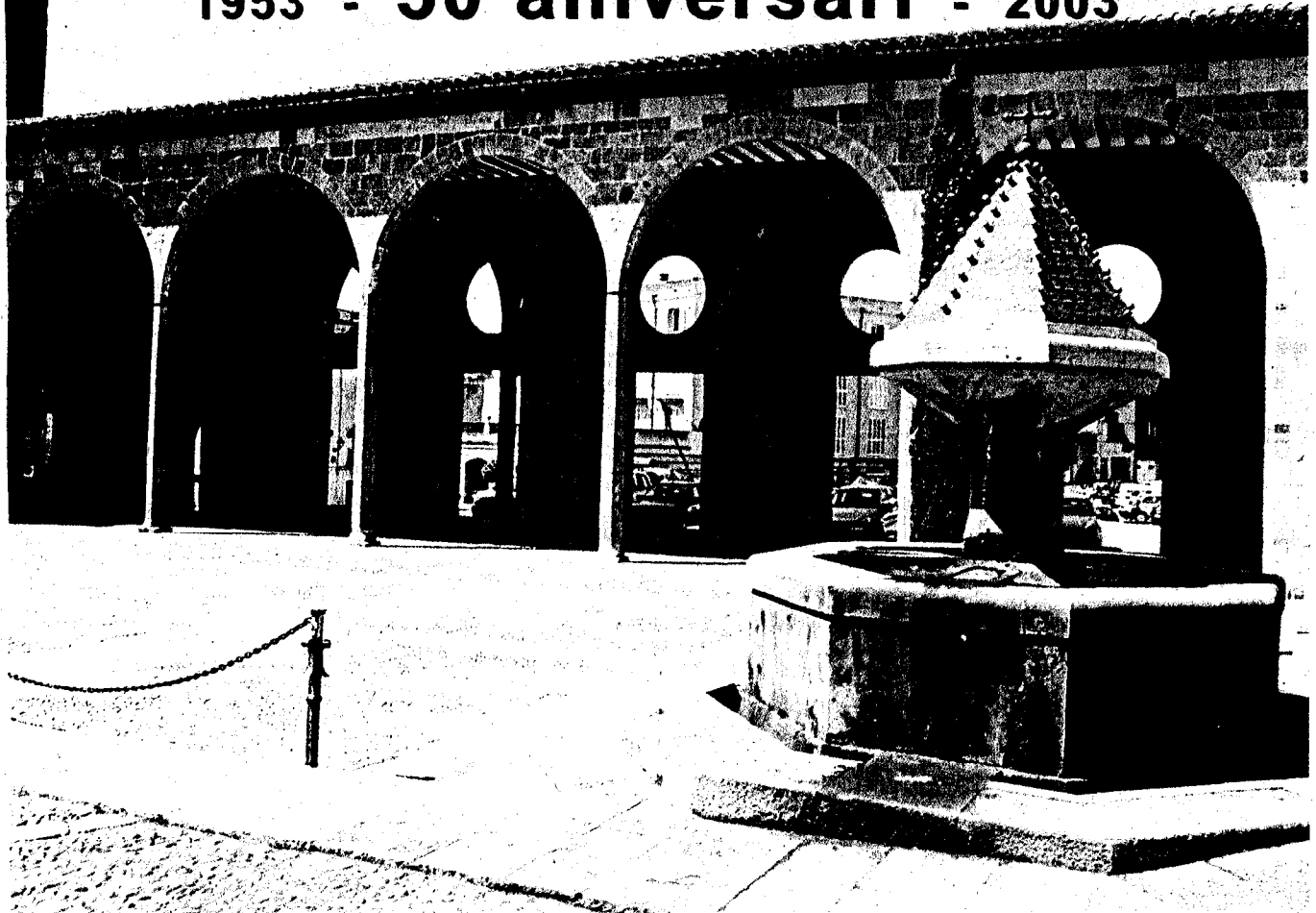
Llotja de Castelló d'Empúries - Remodelació realitzada per Jesús Costa