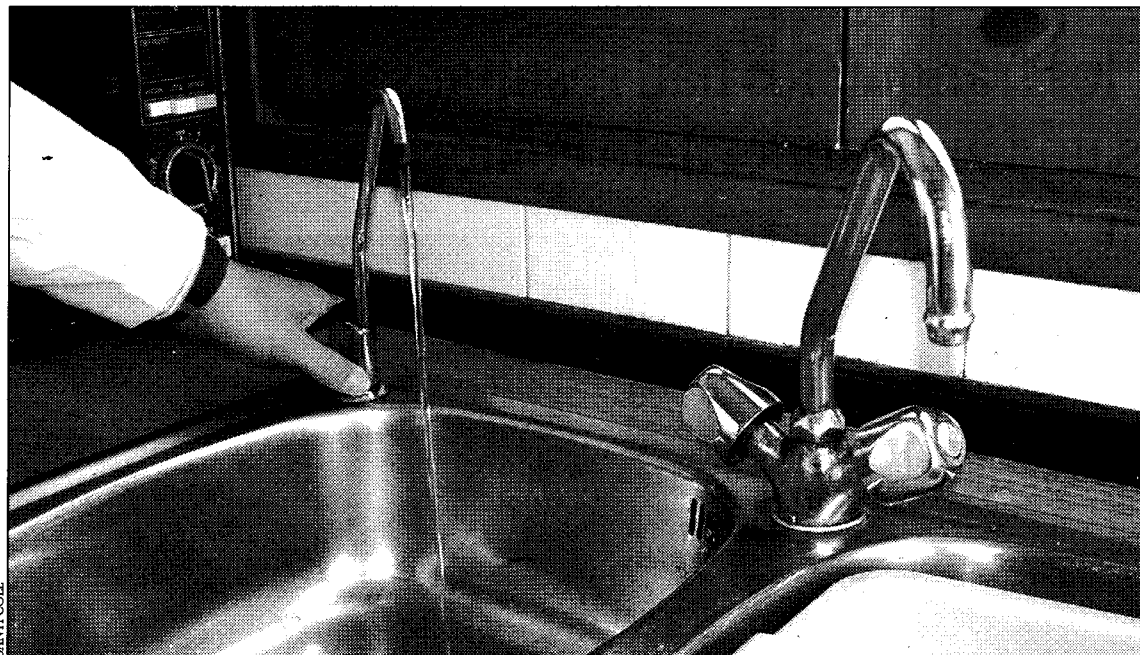
L'aiguera d'una cuina convencional amb la discreta aixeta d'Aquapal Absolut a l'esquerra, d'on en brolla l'aigua filtrada

El sistema va ser patentat temps enrera a Suècia i ha revolucionat el món. Els experts consideren que és un dels millors depuradors domèstics que existeixen avui en dia. L'aparell