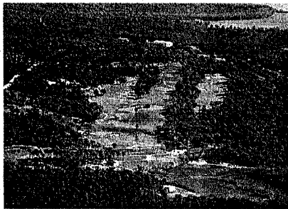
► Les Gavarres. Continuen amb una protecció insuficient en relació amb la seva importància, situació que ha fet possible accions recents com la de la polèmica construcció de la línia elèctrica d'alta tensió de la companyia Fecsa-Endesa.