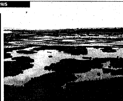
► Els aiguamolls de l'Alt Empordà. El parc natural és l'espai de les comarques gironines més consolidat pel que fa a gestió, conjuntament amb el de la Zona Volcànica de la Garrotxa. La protecció també va arribar gràcies a l'acció ecologista.