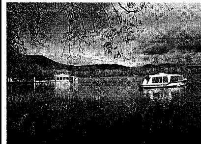
► L'estany de Banyoles. No té cap instrument normatiu del govern català aprovat definitivament. Té pendent l'aprovació definitiva de la seva delimitació des del juliol de l'any passat, quan s'hi va donar el visticplau provisional.