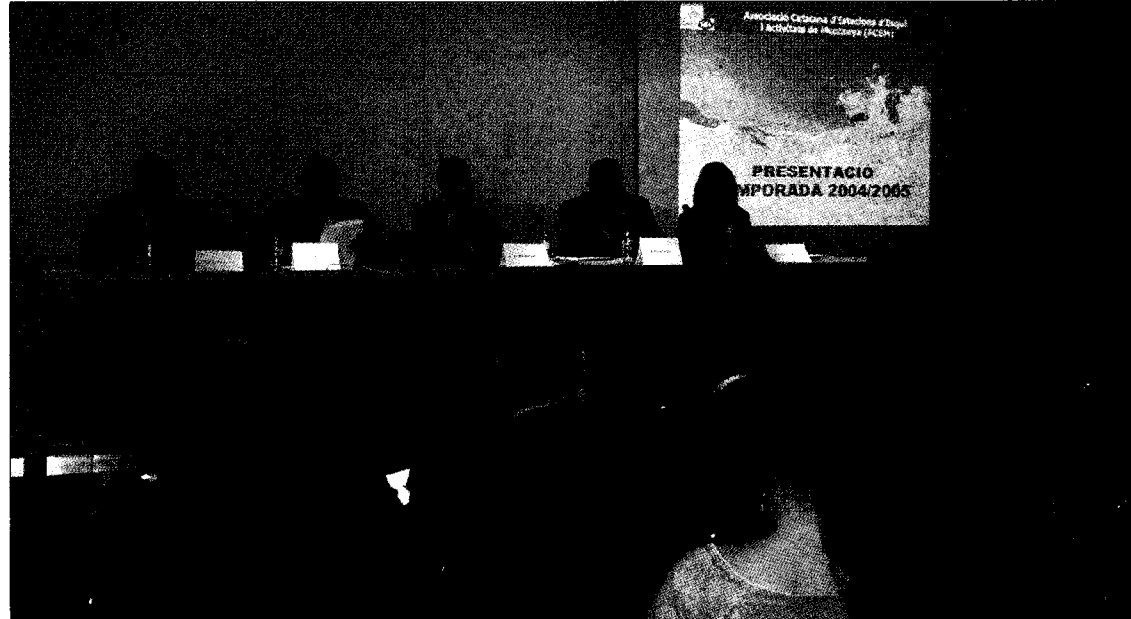
Un moment de l'acte de presentació ahir de la nova temporada d'esquí a Catalunya

gut tancar ara, però considera que «els resultats que tinguem aquest any com a Alp 2.500 han de ser el punt de partida per engegar la temporada que ve amb el forfet únic». Un acord que entén que a la Cerdanya li ha de permetre disposar «d'un gran producte diferenciat que ens farà més atractius». La potenciació d'Alp 2.500 s'apunta, a més, com una de les cartes a jugar per intentar sanear l'economia de La Molina, amb un deute de 2 milions d'euros. Des d'aquesta estació de Ferrocarrils de la Generalitat de Cata-