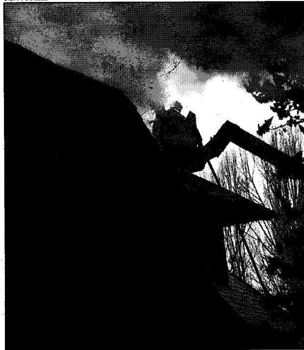
El fum va persistir durant hores. Al'edifici hi havia molta fusta