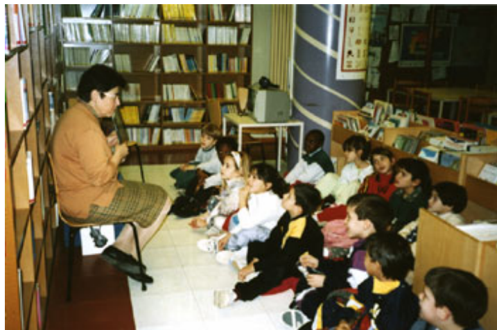
1999.- Visita escolar

A l'abril de l'any 1997 es remodela la zona infantil . Es treuen unes quantes de les taules, l'espai per fer treballs escolars es redueix i a canvi s'obre un espai més informal per a la lectura, amb uns quants coixins per poder llegir còmodament. S'introdueix un visor de videos, un lector de CD i un ordinador amb lector de CD Roms per a jocs. El mes de gener de 1998 s'incorpora un altre ordinador destinat a la cerca d'informació en enciclopèdies i a la realització de treballs. El setembre d'aquest mateix any, es posa en marxa la informatització de la biblioteca i ens arriba la connexió a internet. Amb poc temps la secció infantil comptà amb un Opac de consulta del catàleg, un ordinador per a les funcions de préstec i gestió, un ordinador per a jocs i dos per a treballs i cerca d'informació. Més endavant i per tal de millorar l'ambient de treball de la sala infantil, es va eliminar el visor de videos i el lector de CD's, i l'ordinador de jocs només podia ser utilitzat amb la companyia d'un adult, mentre es potenciava l'ús dels ordinadors de treball i es facilitava el seu accés a partir de la consulta online de la Gran Enciclopedia Catalana , i de la plana de recursos electrònics de la nostra web.