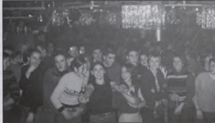
Alguns joves a la festa de veterans.

un èxit perquè no hi va haver cap incident, tot i que pensen que podia haver vingut més gent si el dinar de la Font Vella no s'hagués anul·lat i el temps hagués acompanyat. La festa va anar acompanyada per un striptess masculí i un de femení perquè tothom estigués content. Abans que es fes aquest espectacle, el locutor i ubano de Sant Hilari, Romaní, va acompanyar-nos posant la música.