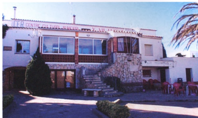
Antiga façana del Centre Cultural Municipal Xavier Vilanova, estatge social del CER.