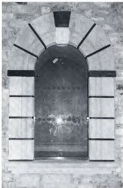
S'INAUGURA EL NOU RETAULE DE SANT PATLLARI