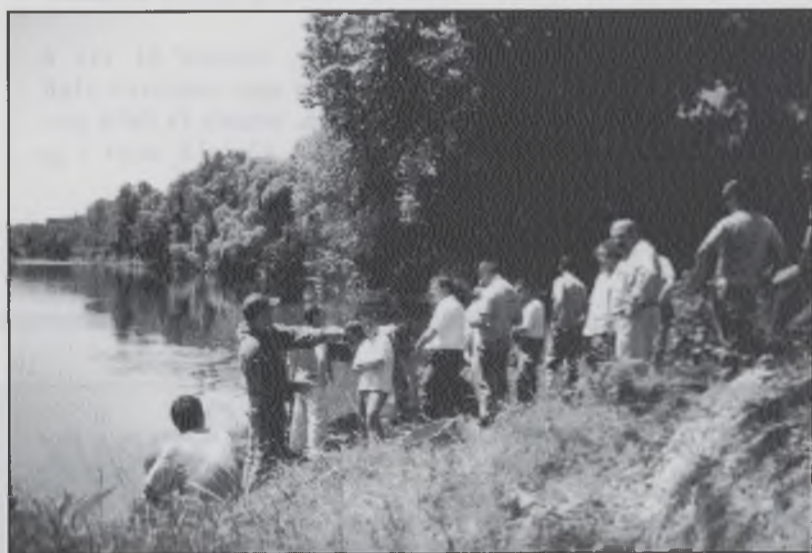
Grup de pescadors