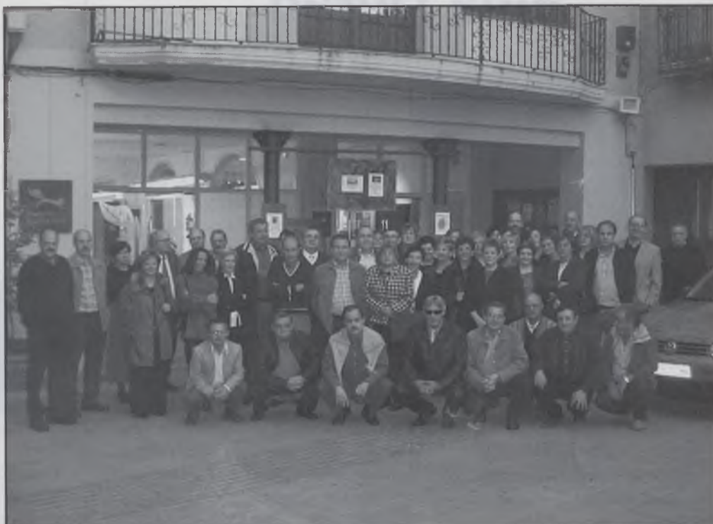
Grup dels 50 anys