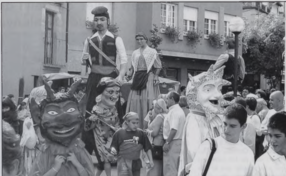
Colles de gegants