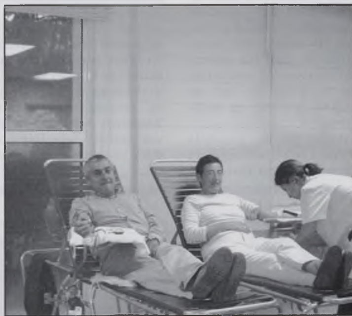
Aula on es feien les Jornades

300.000 donacions de sang a l'any, perquè cada any, gràcies a les transfusió sanguínia, se salven moltes vides i perquè aquestes donacions faran que els bancs de sang puguin obtenir els components sanguinis necessaris per al tractament de moltes malalties.