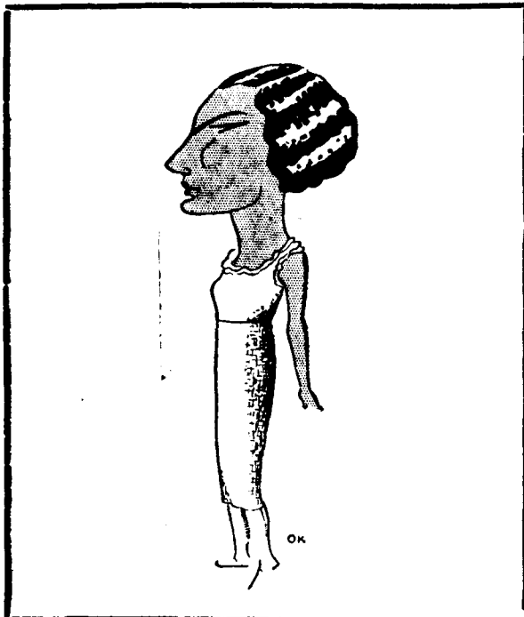
Una morena de la primera volada. Fa honor a la generació del segle XX

Veieu, doncs, com tot hi està comprès. Les coses es fan així: Primer es pensen i es detallen. Els pressupostos són per això.