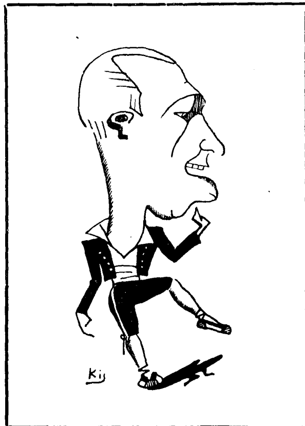
La sardana és la dansa més bella de totes les dances que es fan i es desfan, la sardana és com la xocolata que com ella la fan i després la desfan.