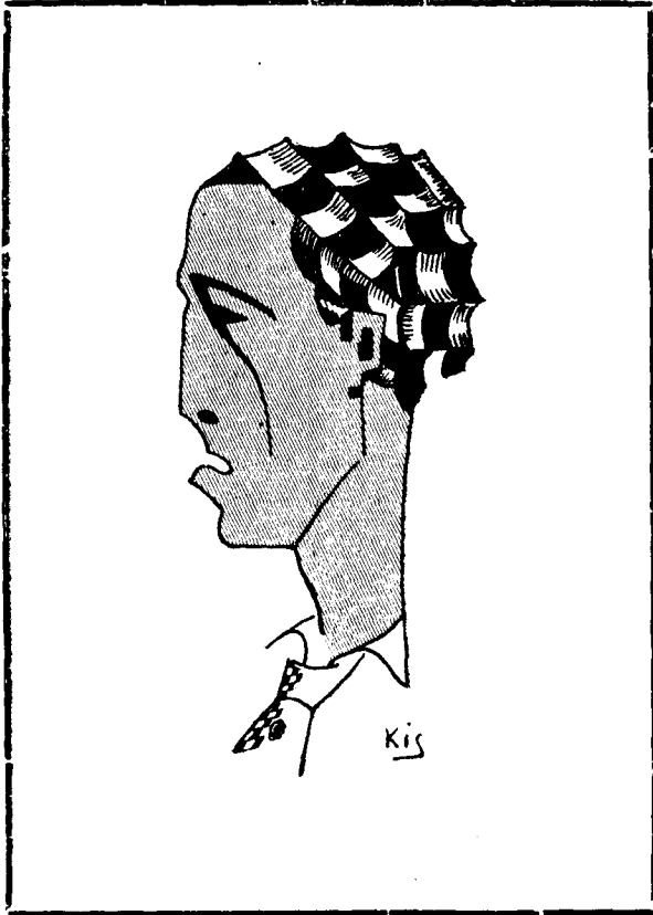
El teniente seductor...? De tinent no ho és encara de lo altre en té la cara però res més: el coll ja no.